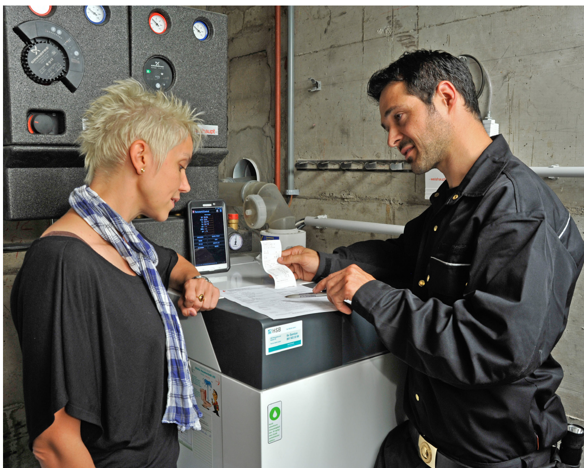
La communication comme la clé du succès.