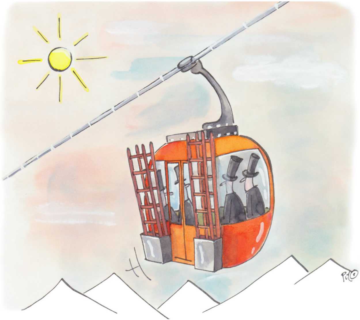
Gondole (caricature de pül)