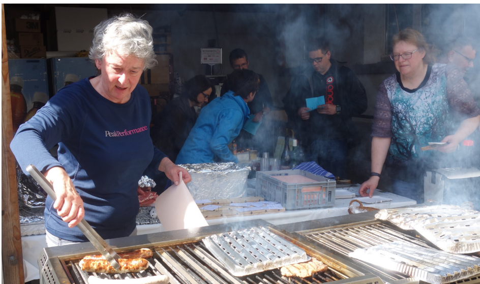
Il team del Segretariato centrale impegnato all'annuale fiera in casa.