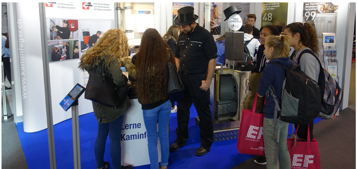
Grande affluenza allo stand informativo degli spazzacamini alla fiera delle professioni a Zurigo.