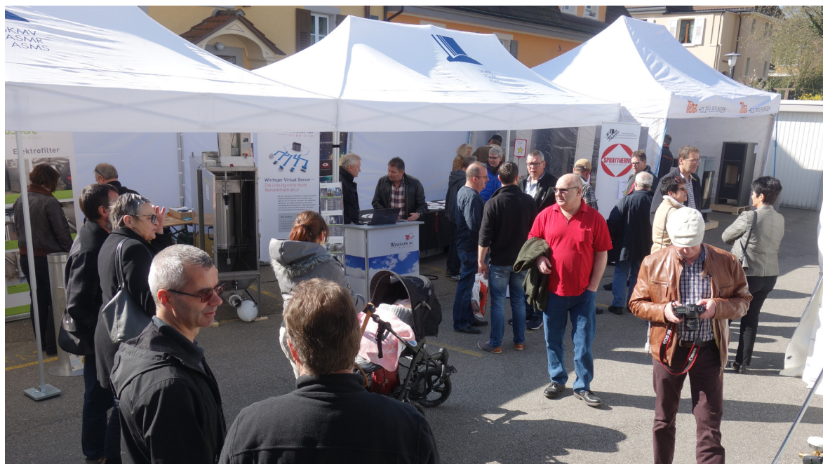
La fiera in casa Spazzacamino Svizzero, manifestazione molto apprezzata, dove i visitatori si informano sui nuovi prodotti.